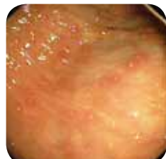
Foto 8. Colite de Crohn (lesões iniciais)