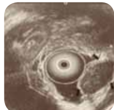
Foto 2. Ecoendoscopia – tumor submucoso