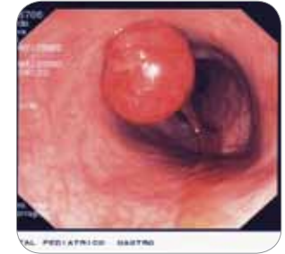
Foto 2. Aspecto endoscópico do pólipó juvenil que foi encontrado na criança que apresentou as rectorragias ilustradas na Foto 1.